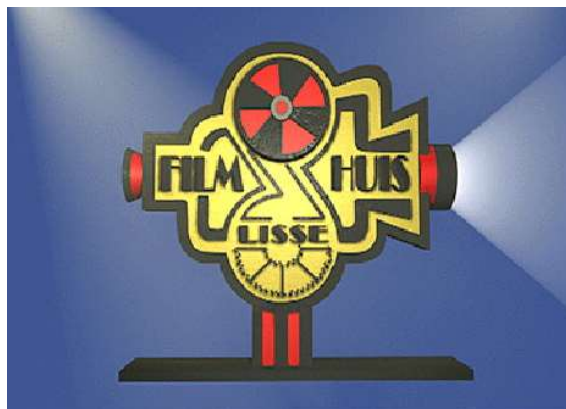
Filmhuis Lisse, opgericht in 1981

Vanaf afgelopen theaterjaar 2021 kan men enkel kaartjes kopen via betaalsysteem "Mollie", dat gekoppeld is aan de website van het FHL. Tien dagen voor iedere voorstelling zijn de kaartjes te koop. De reserveringskosten bedragen € 0,50 per reservering.